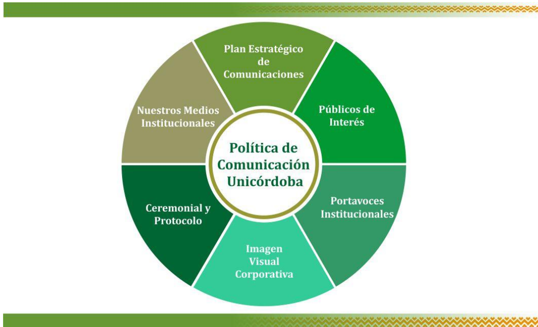
Figura 2. Política de Comunicaciones Unicórdoba

Fortalecer la imagen de la Institución al interior del claustro universitario, en el entorno local, regional, nacional e internacional, mediante la implementación de estrategias de comunicación y participación, el uso de medios, la identidad corporativa, relaciones públicas, métodos de comunicación efectivos y creación de contenidos acordes con la misión, planes y proyectos institucionales, que permitan la interacción con sus públicos y la satisfacción de sus usuarios y grupos de interés.